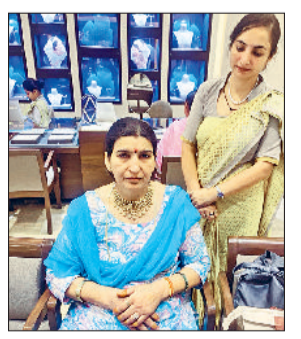
भूी सुनहया बनाने के लिए तनिष्क हीरो के आभूषणों के एमआरपी पर 20 फीसद तक की सीमित अवधि की छूट दे रहा है। इस ऑफर का लाभ सिर्फ 25 अगस्त तक उठाना जा सकता है। इस उद्योग में चलाए जाने वाले कई प्रमोशन सिर्फ स्टोन या कैरट वैल्यू पर लागू होते हैं।

कि भारत का सबसे भरोसेमंद ज्वेलरी ब्रांड और टाटा परिवार का एक सदस्य तनिष्क 'फेस्टिवल ऑफ डायमंड्स स्पार्कलेशर वे' का 2025 का संस्करण पेश कर रहा है। आधुनिक महिला और उनकी कई उज्ज्वल सफलताओं के सम्मान में तनिष्क यह पहल चला रहा है। सिर्फ 15,000 रुपये से शुरू होने वाले प्राकृतिक डायमंड आभूषणों की सोच-समझकर चुनी गयी श्रेणी के साथ यह पहल फैशन चार्ज का नेतृत्व कर रही है। आधुनिक वाइरोब में हीरो को किस तरह से स्टायल किया जाता है और उन्हें किस तरह से संजोकर रखा जाता है। इस खुशियों को और