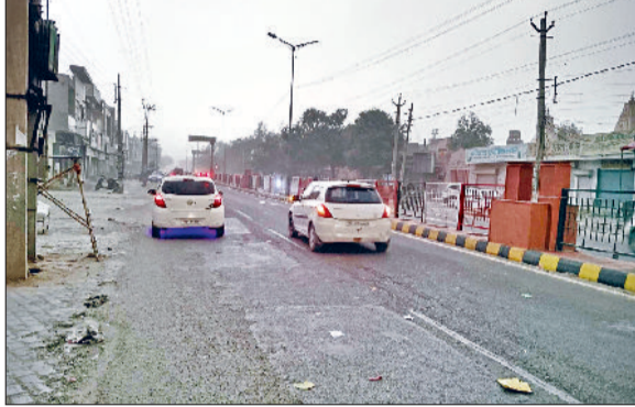
फतेहाबाद। देर रात हुई बरसात के बाद शुक्रवार को मौसम हुआ सुहावा।

लंबे इंतजार के बाद वीरवार रात को मानसून की दूसरी बरसात ने शहरवासियों को राहत प्रदान की। करीब एक घंटे तक झमाझम हुई बारिश से शहर की सड़कों, मुख्य बाजार व कालोनियां बरसाती पानी में डूब गईं। शहर के मुख्य बाजार जवाहर चौक व नेशनल हाइवे पर जलभराव हो गया लेकिन 2 घंटे में पानी की निकासी हो गई। ऐसे विभाग के अनुसार एक घंटे में करीब 32 एमएम बरसात हुई है। सीजन की दूसरी बरसात से किसानों के चेहरे पर राहत लौट आई। किसान खेतों में धान की फसल में पानी भरता देख प्रसन्नचित दिखाई दिए। बरसात ने पिछले कई दिनों से भीषण गर्मी