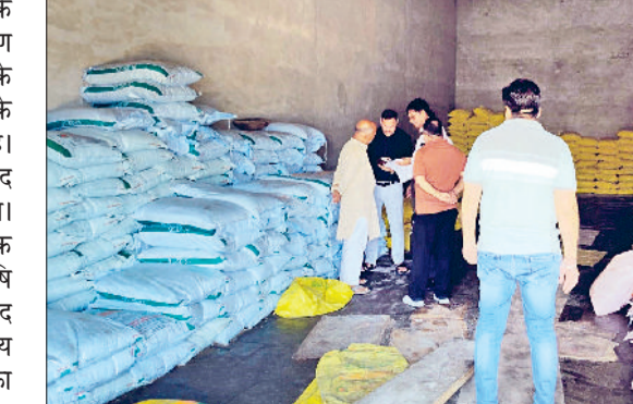
फतेहाबाद। खाद के विक्रेता फर्मों का निरीक्षण करते कृषि विभाग के अधिकारी।

रिपोर्ट जांचा गया जिसमें खाद के स्टॉक में भिन्नता पाई गई। जिस कारण फर्म को शोकाँज नोटिस जारी करके उसका खाद बिक्री लाइसेंस 15 दिन के लिए निलंबित कर दिया गया है। निरीक्षण के दौरान अन्य खाद विक्रेताओं का रिपोर्ट सही पाया गया। इसके अतिरिक्त संयुक्त निदेशक (भूमि संरक्षण) ने जिला के सभी कृषि अधिकारियों को निर्देश दिए कि खाद विक्रेताओं के रिपोर्ट का समय-समय पर अवलोकन करें ताकि खाद का वितरण, उपलब्धता अनुसार सही ढंग से हो सके।