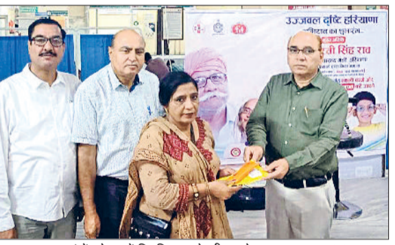
सिरसा। जरूरतमंदों को चश्मे वितरित करते सीएमओ।