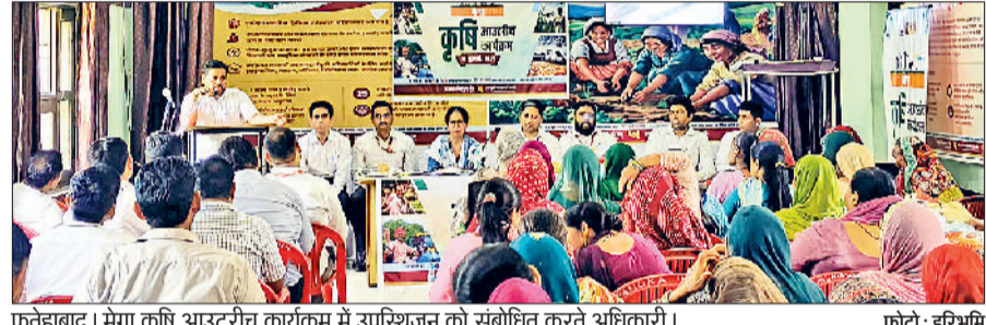
फतेहाबाद। मेगा कृषि आउटरीच कार्यक्रम में उपस्थित को संबोधित करते अधिकारी।