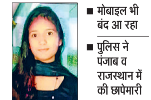
मोबाइल भी बंद आ रहा