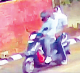
फतेहाबाद। सीसीटीवी में कैद दोनों युवकों की फोटो।

अनाज मण्डी के पीछे स्थित एसबीआई रोड पर सुबह सैर पर निकले एक बुजुर्ग से एक्टिवा पर आए दो युवकों द्वारा सोने की अंगूठी छीनकर फरार होने का मामला सामने आया है। युवकों ने सैर पर निकले एक बुजुर्ग को पता पूछने के बहाने रोका और उससे करीब 10 ग्राम सोने की अंगूठी छीनकर फरार हो गए। बुजुर्ग ने शोर मचाते हुए युवकों का पीछा भी किया लेकिन दोनों युवक मौके से भाग निकले। इस बारे सूचना मिलते ही पुलिस टीम मौके पर पहुंच गई और बुजुर्ग से मामले की जानकारी लेकर दोनों युवकों की तलाश शुरू कर दी है। मिली जानकारी के अनुसार बतरा