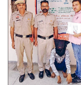
टोहाना। पुलिस गिरफ्त में घर में चोरी के आरोपी पकड़ा गया युवक।