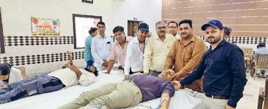
भट्टकला। रक्तदाताओं को प्रोत्साहित करते अतिथिगण।

खुशी नई उम्मीद वेलफेयर सोसायटी द्वारा अग्रवाल धर्मशाला भट्टमंडी में रक्त दान कैंप का आयोजन किया गया। इसमें स्टेट बैंक ऑफ इंडिया