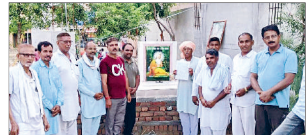
टोहाना। विलय बारे जानकारी देते हुए दोनों ट्रस्ट के पदाधिकारी।

अधिकारियों का गांव में पहुंचने पर स्वागत किया और इस प्रकार के कार्यक्रम को किसानों के लिए ज्ञानवर्धक बताया।