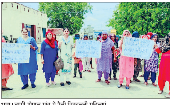
भूना। ढाणी गोपाल गांव में रैली निकालती महिलाएं